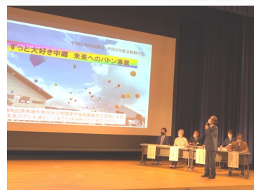
3月11日⑤に開催した 令和4年度中郷区地域協議会委員活動報告会（はーとぴあ中郷 ホール）の様子