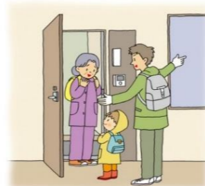
情報活用による 早めの避難行動