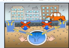
下水道の排水能力超え

地形などを踏まえ、その時の浸水状況に応じ、建物上層階や指定緊急避難場所への避難が必要となります。