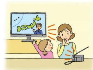
積極的な情報収集