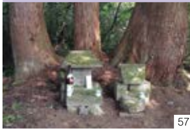
天水分神（中郷区） 四ツ屋町内会・岡川町内会・八斗蔭町内会