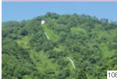
城山遺跡と城山神社例祭（和田区） 城山管理者