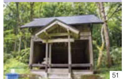
「宇津尾集落」（金谷区） 宇津尾町内会