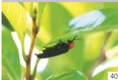
仁上のほたる（大島区） 仁上町内会