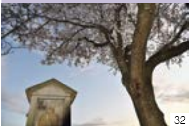
越柳の雨乞い地蔵（三和区） 越柳町内会