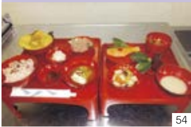
牧の田植節句・お刈り上げ祝い・とうと呼び（牧区） 特定非営利活動法人よもぎの会