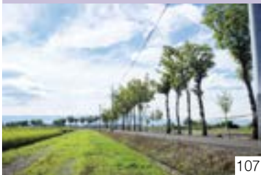
米岡のはさ木道（諏訪区） 米岡町内会