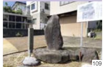
農耕牛馬装束跡と馬頭観世音碑（和田区） 大和二丁目町内会・大和二丁目農家組合