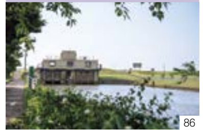
「新堀川開鑿由来記碑」・「新堀川暗渠排砂揚水機場」（大潟区） ボランティア団体「だいはま会」