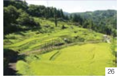
中ノ俣集落 角間の棚田景観（金谷区） 特定非営利活動法人かみえちご山里ファン倶楽部