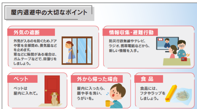
屋内退避のポイント