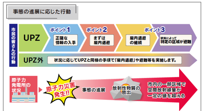
避難行動のポイント