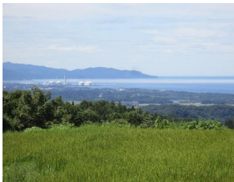
集落から望む日本海

人と犬 1 匹が移り住みました。移住者の方々に話を伺うと「子どもたちが豊かな自然を満喫し、泥だらけになりながら遊ぶ姿を楽しみたいです」「ここから見える景色は最高です。地域の人と交流を深め仲良く暮らしたいです」と新たな生活に希望を膨らませていました。隣りの集落下牧には、地域の季節感や風土、人柄を知ってもらうための移住体験ハウスがあります。塞の神などのイベント体験を通して地域の人たちと交流し、親身になって移住希望者の相談に関わっています。地域と移住希望者が一緒になって考えたことが、今回の移住を呼び込む大きな結果となりました。