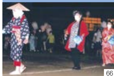
伝統の盆踊り「十三夜」（柿崎区） 下黒川「十三夜」保存会