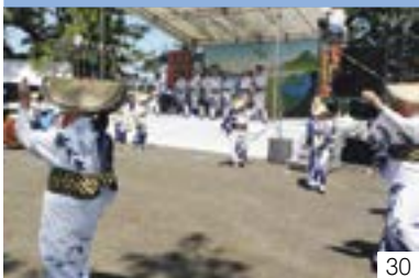
大潟米大舟（大潟区） 大潟米大舟保存会