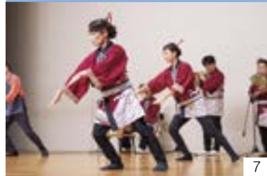
直江津舟方節（直江津区） 直江津民謡保存波路会