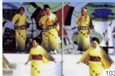
大潟町八社五社（大潟区） 大潟町八社五社保存会