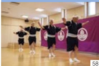
井ノ口三丈古代詞（三和区） 井ノ口芸能保存会