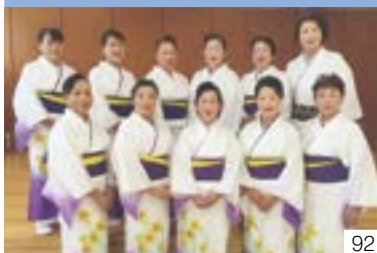
越後さんわ音頭（三和区） 越後さんわ音頭継承普及会