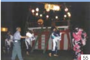
高尾ヨンヤナ・高尾古代詞（牧区） 高尾町内会