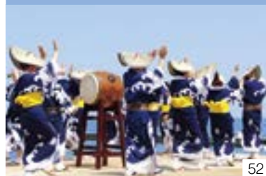
夷浜米大舟（八千浦区） 夷浜米大舟保存会 舟踊会