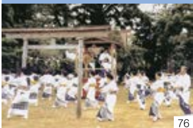
高士八社五社（高士区） 高士八社五社保存会