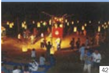
谷浜・桑取昔ながらの盆踊り（谷浜・桑取区） 夢に出てくる盆踊り実行委員会