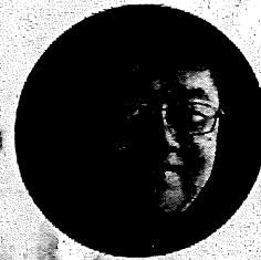
齋京四郎 (県議会議員)