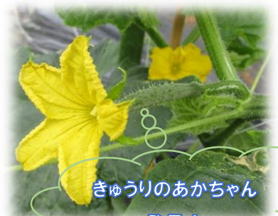
きゅうりのあかちゃん 発見!

毎月19日は食育の日 食育集会を実施し、みんなで食事や食材、栄養・マナーを学んでいます。