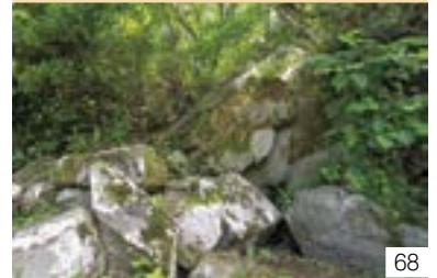
聖の窟 (板倉区) 聖の窟保存会