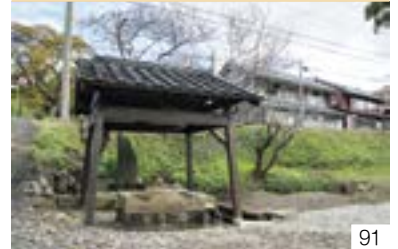
どんどの石井戸 (大潟区) 辨天池水道組合