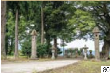
田井国分寺地内の天神社 (板倉区) 田井町内会