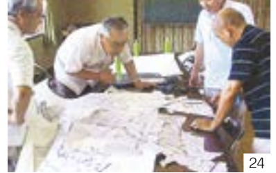
本長者原廃寺跡 (越後国分寺推定地) (三郷区) 三郷地区の歴史・史跡を研究する会