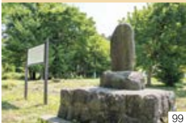
千手観音堂 (津有区) 四辻町町内会