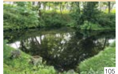
どんどの池 (弁天池) (大潟区) 九戸浜町町内会