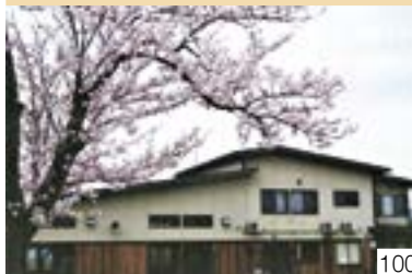
新屋敷分教場跡 (戸野目小学校第二分校) (津有区) 四辻町町内会