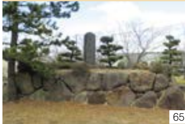
福島城址 (直江津区) 福島城を愛する会