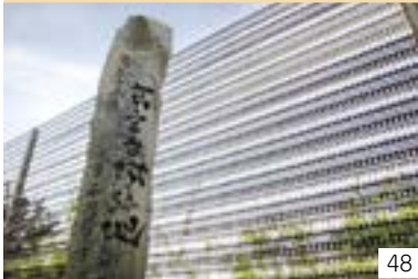
古宮台場跡地 (大潟区) ボランティア団体「だいばま会」