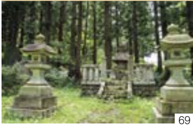
患信尼公顕彰公園 (板倉区) 聖の窟保存会