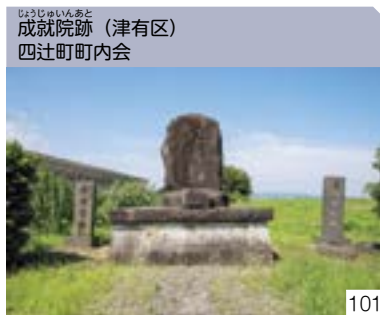
成就院跡 (津有区) 四辻町町内会