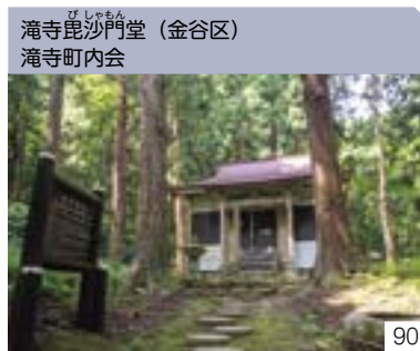
滝寺毘沙門堂 (金谷区) 滝寺町内会