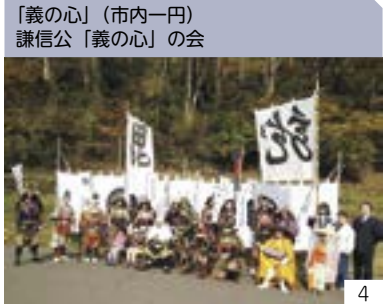
「義の心」(市内一円) 謙信公「義の心」の会