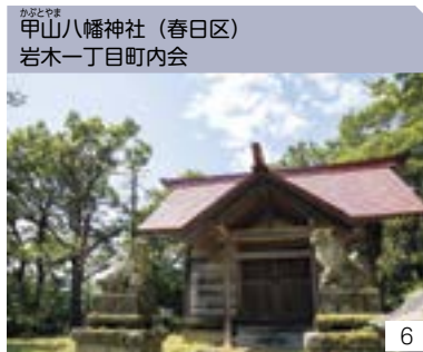
甲山八幡神社 (春日区) 岩木一丁目町内会