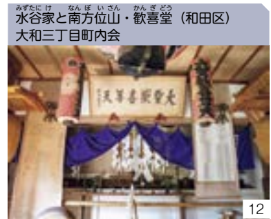
水谷家と南方位山・歓喜堂 (和田区) 大和三丁目町内会