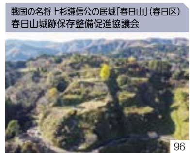
戦国の名将上杉謙信公の居城「春日山」(春日区) 春日山城跡保存整備促進協議会