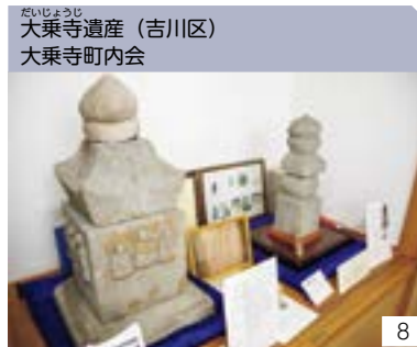
大乗寺遺産 (吉川区) 大乗寺町内会