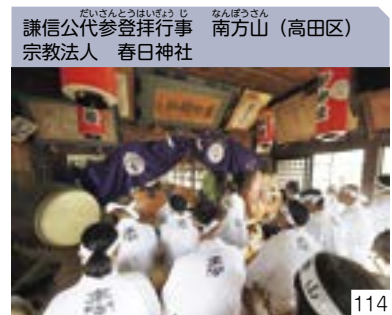
謙信公代参登拝行事 南方山 (高田区) 宗教法人 春日神社