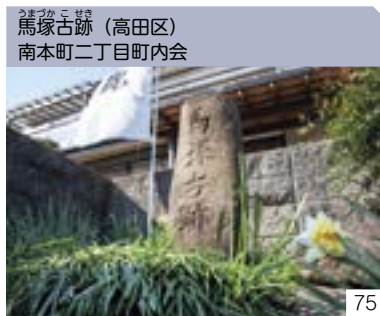
馬塚古跡 (高田区) 南本町二丁目町内会