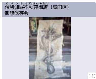
俱利伽羅不動尊御旗 (高田区) 御旗保存会