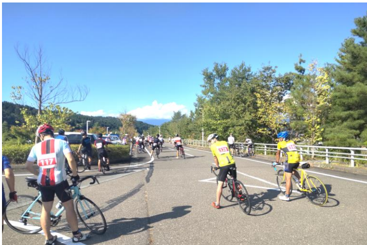
スタート時の様子