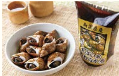
柿崎産黒バイガイの雪中梅旨煮