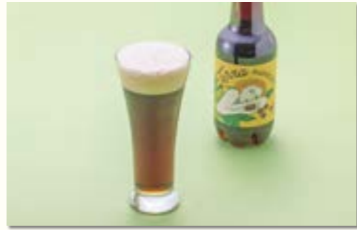
マローネ (上越産粟を使用)