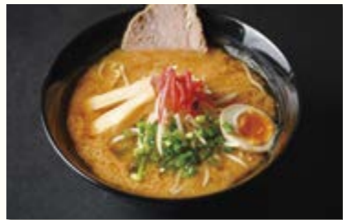
元祖雪室酒かすみそラーメン