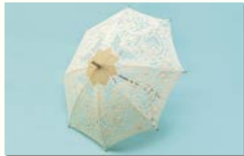
バテンレース 日傘