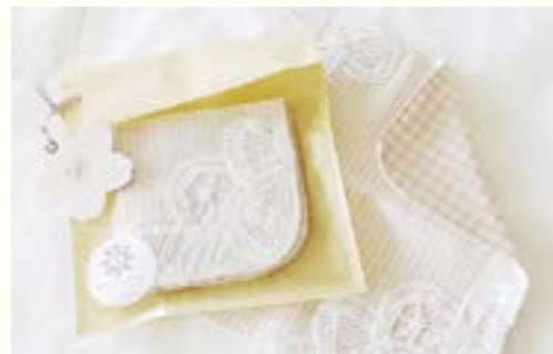
バテンレース ハンカチ