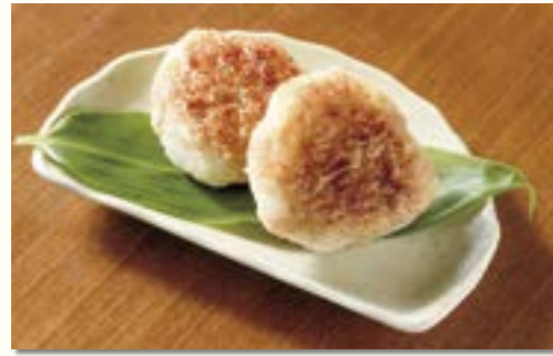
冷凍焼きおにぎり (上越産米・醤油を使用)