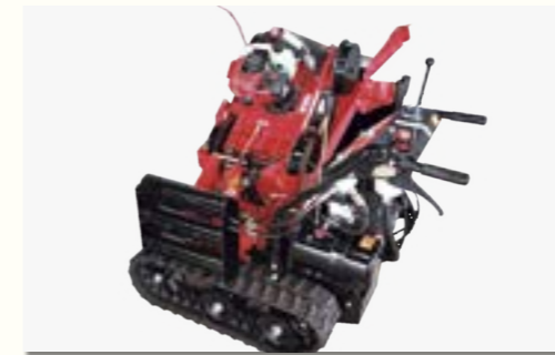
親子式傾斜地草刈機KHM400W