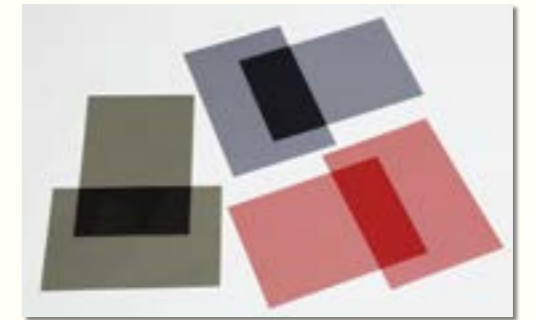
ポラリスト®/POLARIST® (染料系偏光フィルム)