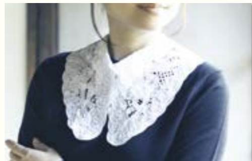
バテンレース つけ襟