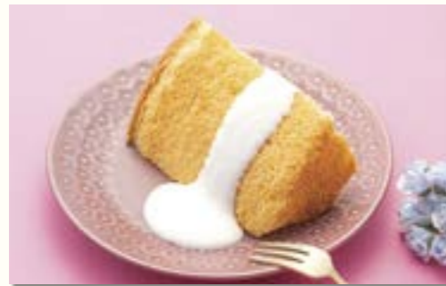
みそシフォンケーキ (上越産米粉・味噌を使用)