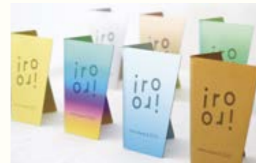
チタントロフィー