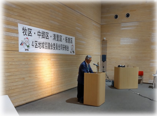
平井会長による開会挨拶

研修会の後には参加者による情報交換会も行われ、委員はそれぞれ他の地域協議会委員や協力隊の方と意見交換を交わしながら、和やかな雰囲気の中で親睦を深めていました。