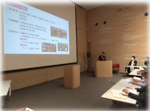
各区の取組状況の発表