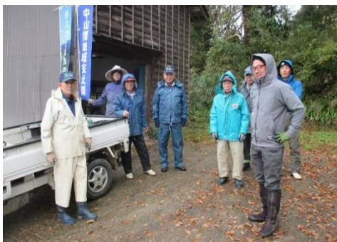
東横山集落で作業した方々

せんでしたが、莊司協力隊が参加し大きな戦力となりました。清水農家組合長は、来年こそ支え隊の参加