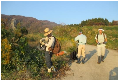
水野集落の電気柵撤去作業

11月5日～6日の2日間に渡って水野集落で8人の参加を得て、電気柵撤去作業が行なわれました。中山間地域支え隊等の協力はありま