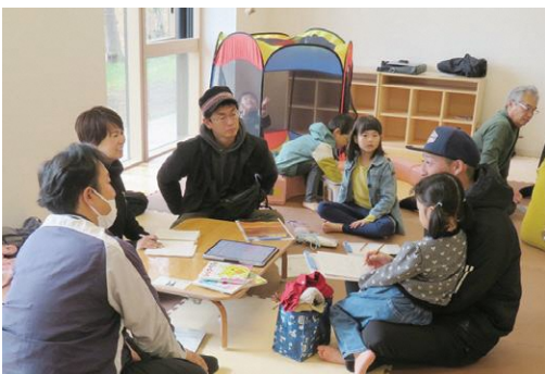
11/12㊨ 議員と気軽にトーク@こどもセンター