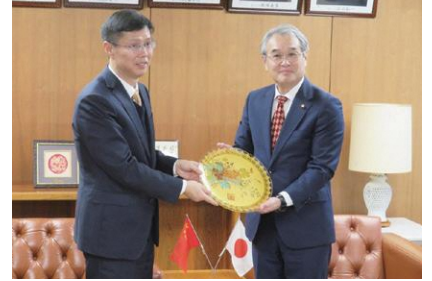
崔総領事から記念品をいただきました