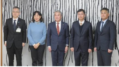
(左から) 小田副市長、康副総領事、石田議長、崔総領事、渡邊副議長