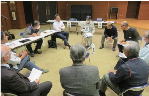
11/9㊦ ご意見を聴く会 (板倉区)