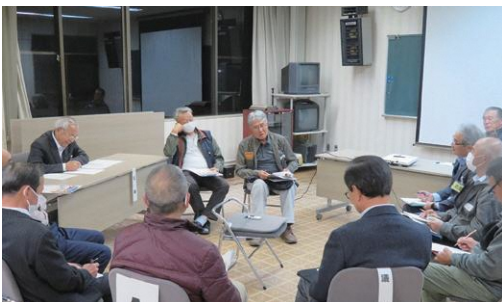
11/10㊧ ご意見を聴く会 (安塚区)