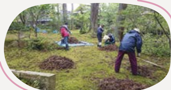
くびきまちづくり隊が実施した 瀧本邸の一般公開に向けた清掃活動

区内のさまざまな団体との意見交換から、各団体とも会員の減少・高齢化という課題を抱え、活動の継続に不安を感じていることが分かりました。地域協議会の議論の中で出されたアイデアを基に、昨年4月にくびき振興会が事務局となって、人手が必要な団体と協力したいと思っている人とをマッチングし、ボランティア活動をする「くびきまちづくり隊」の取り組みがスタートしました。