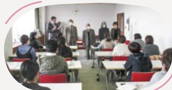
各保育園の保護者会役員と 地域協議会委員とで意見交換を実施

柿崎区では、区内4つの保育園で保育サービスに差が生じていることや、施設の老朽化の進行が課題となっていました。協議会では、各園の視察や保護者会役員との意見交換などを行いながら、4園の将来的なあり方について8年間にわたり審議し、4園統合の必要性を見いだしました。そして、昨年3月に市へ4園の統合を求める意見書を提出し、市からは統合に向けた検討を行うとの回答を得ました。