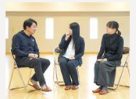
地域への思いを熱く語る3人