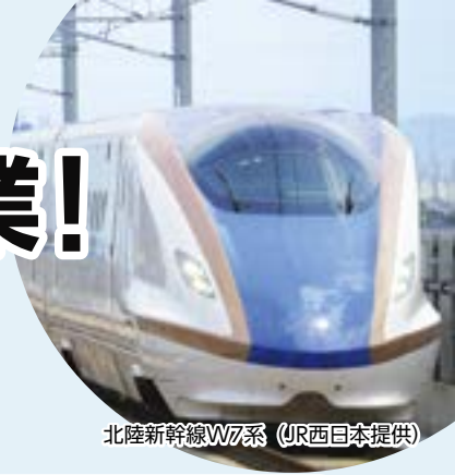
北陸新幹線N700系

平成27年の長野~金沢間開業で、首都圏・北陸方面への移動がぐっと便利になった北陸新幹線。3月16日(土)、いよいよ金沢~敦賀間が開業し、関西・北陸圏がさらに近くなります。