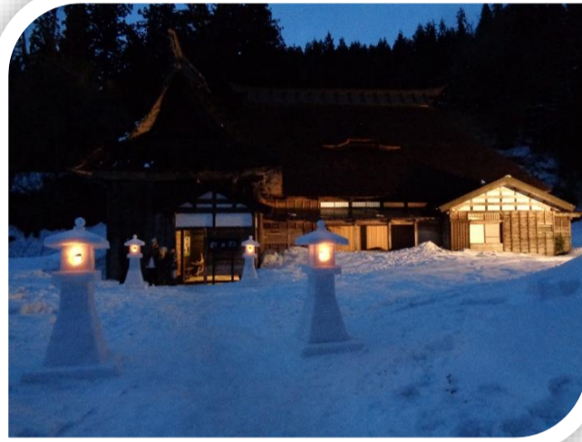
▲飯田邸がライトアップ