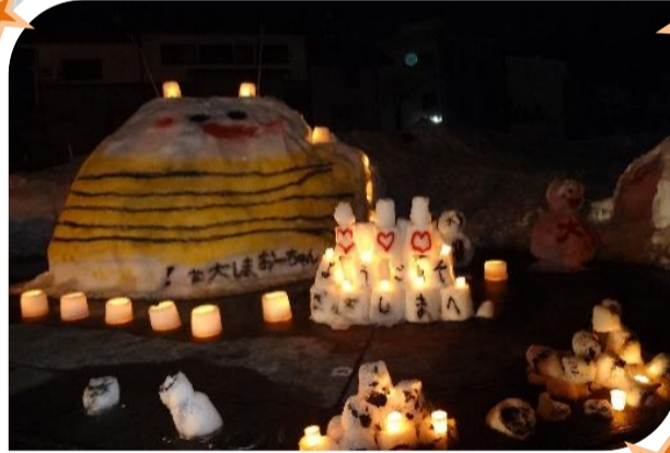
▲大島小学校の子どもたちがおーちゃん作成