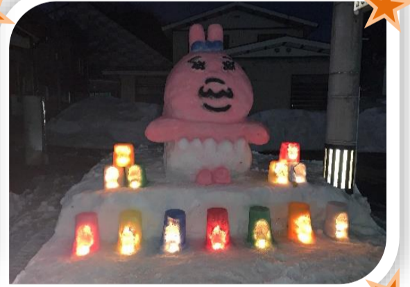
▲大平郵便局前はカラフルな灯火