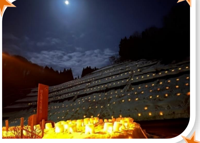
▲月明りに照らされるほくほく大島駅の雪ほたる