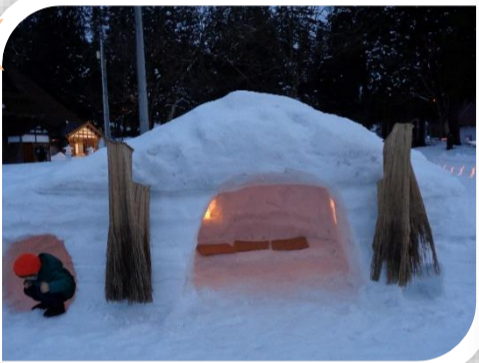
▲あかりが灯るかまくら（菖蒲会場）

2月24日（土）に「灯の回廊」が、3月2日（土）は薬師岳で「ユキノアカリ」が開催されました。雪明かりに照らされた、各会場の幻想的な情景を紹介します。