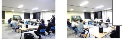
【施設経営管理室、行政改革推進課から説明を受けている様子】

【協議事項】自主的審議事項について ・今後、第3回地域協議会で出された意見について、掘り下げていくこととなります。