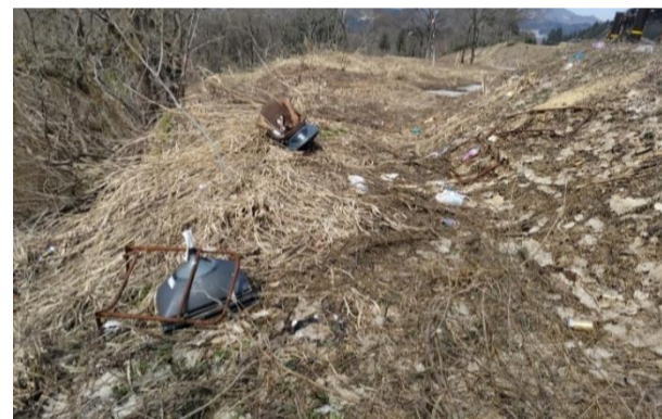
▲大島区内での不法投棄の様子