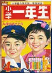
『小学一年生』1962年4月号