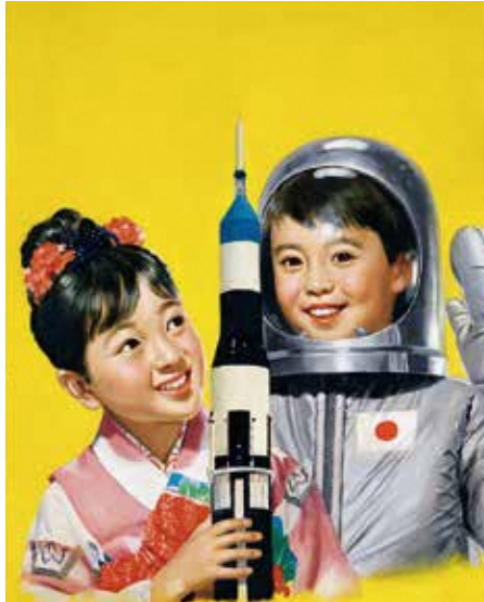
『小学二年生』1970年1月号 表紙絵原画 個人蔵