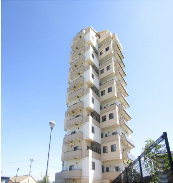
写真：港町特定公共賃貸住宅