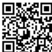
(安全メール登録用)