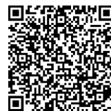
「たより」のバックナンバー