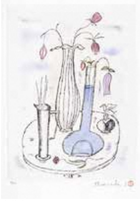
斎藤真一 《紅つめ草の静物「哀歌(豪華本限定本A)」》