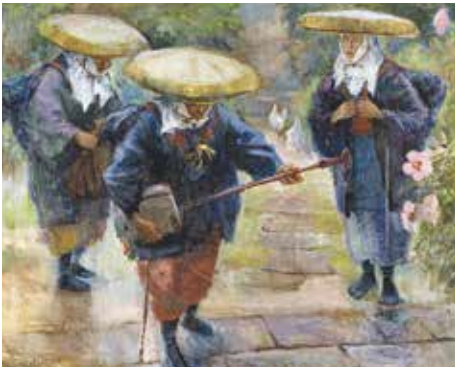
仲田大二 《醫女と花》