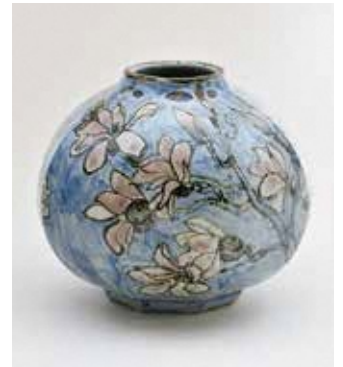
齋藤三郎 《染付辰砂木蓮文壺》