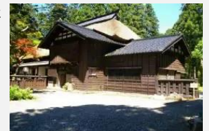
林富永邸（市指定文化財）

「上越市歴史的建造物等支援基金」に積み立て、歴史的建造物等の保存・活用の取組に活用しています。