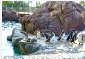
マゼランペンギンミュージアム

水族博物館うみがたりの展示内容の充実や将来的な施設改修、マゼランペンギンの保全活動に活用しています。