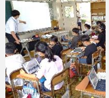
小学校の授業ではICT教材を活用

学校や図書館、公民館等で、児童書を中心とした図書の購入や、小中学校の教材充実のために活用します。