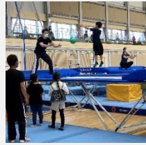
ジムリーナでのトランポリン教室（大潟区）

東京2020オリンピック・パラリンピックの開催を契機とした、ドイツとのスポーツ・文化交流の推進や機運醸成の取組のほか、その他スポーツ振興の取組に活用します。