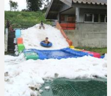
地域独自の予算で「真夏の雪山スプラッシュ」を開催（安塚区）

市内の各地域での住民の皆さんの活動を支える取組や、市内各所の資源を活用しながら地域の活力を高めていく取組など、多様な地域の特色をいかしたまちづくりに関する取組に活用します。