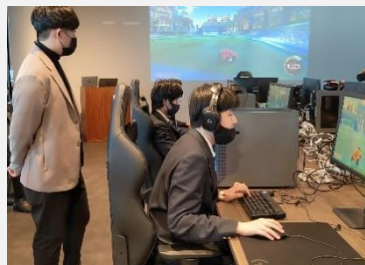
上越5e協議会eスポーツ部会の取組