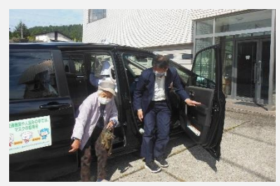
コミュニティバスの運行