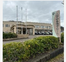
施設内の電話設備を改修

「上越市社会福祉施設整備基金」に積み立て、社会福祉施設整備のための資金として活用します。