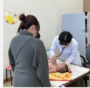
妊産婦・子ども医療費助成の取組

子育て世帯の経済的な負担を軽減するため、妊産婦・子ども医療費や不妊不育治療費を助成しています。