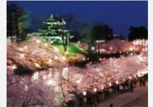
高田城址公園の夜桜

「日本三大夜桜」の一つとされる高田城址公園の桜の保全活動や、公園全体の整備、景観形成による魅力向上に取り組んでいます。