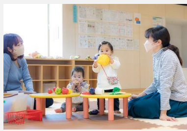
こどもセンターの運営