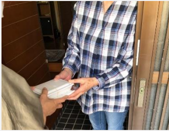
ふれあいランチサービスによる配食

ひとり暮らしの高齢者等への配食・見守りサービスの提供など、高齢者福祉の推進のために活用します。