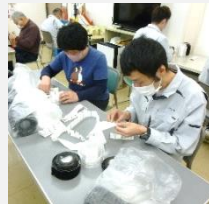
就労支援事業所での生産活動