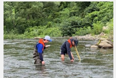
名立区小水力発電導入可能性調査