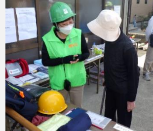
防災アドバイザー（兼防災士）の活動の様子

令和6年1月1日の能登半島地震への災害支援としていただいた寄附金は、自主防災組織の活動支援事業など災害に強いまちづくりに活用していきます。