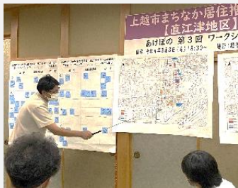
まちなか居住ワークショップ

用途の指定がない場合は、上記のほか、市の重点施策（まちなか居住推進事業、地域DX、脱炭素社会推進事業などに）に活用します。