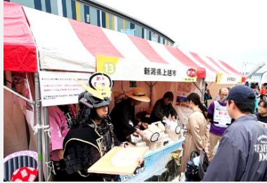
市内農業者の首都圏イベント出店

首都圏等で開催されるマルシェや商談会への出店、ホームページやECサイトの改修、新たな商品パッケージやパンフレットの作成などに必要な経費の一部を支援しています。