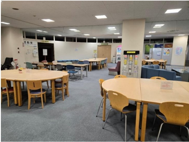
市民プラザ 2階市民談話コーナー