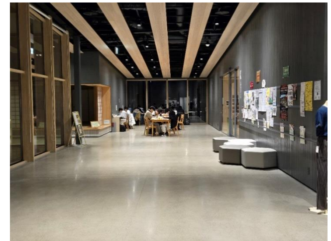
オーレンプラザ 交流スペース(Wi-Fiあり)