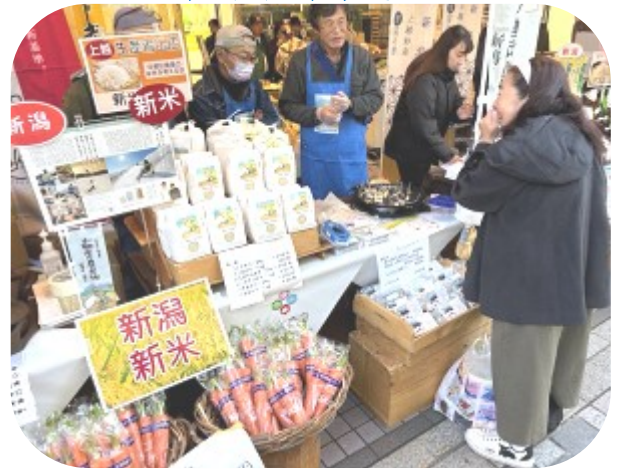
◀東京交通会館雪国マルシェ

中郷区農業の未来を考える会のメンバーの皆さんが、11月23日(土)・(祝)と24日(日)に東京交通会館雪国マルシェ（JR有楽町駅前）で、11月25日(日)には日本曹達(株)本社（東京丸の内）で、新米やお餅、野菜といった中郷産農産物をPRする販売会を開催しました。東京へ出向いての販売会は、雪国マルシェ、日本曹達(株)本社ともに昨年に続き2回目となり、持ち込んだ農産物は飛ぶように売れ、販売量が前回比約2倍となる盛況ぶりでした。