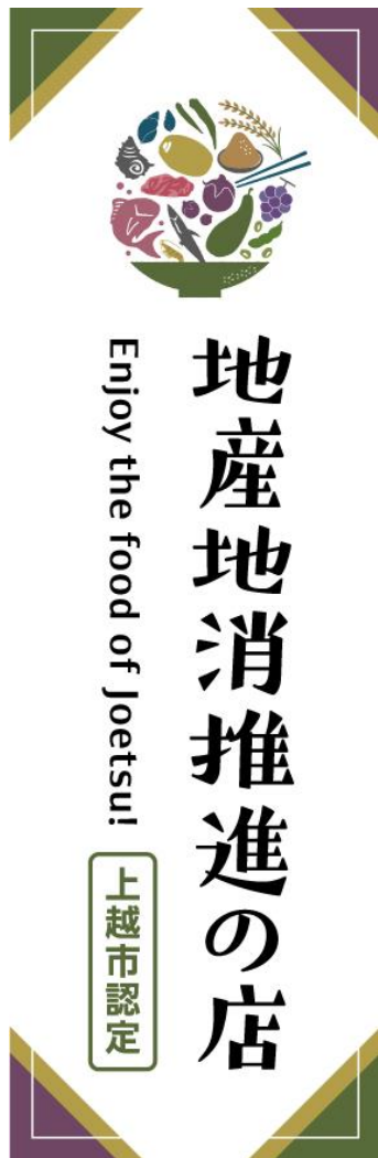
ミニのぼり旗 (サイズ:100mm×310mm)