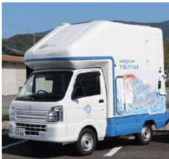
当市で導入予定のトイレカー