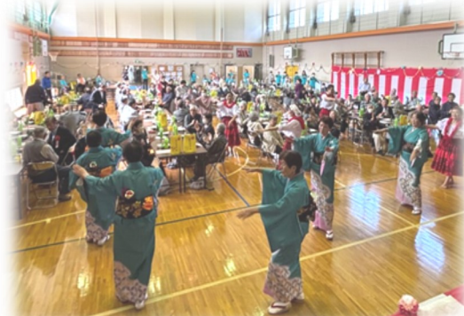
みんなで松ヶ峯温泉音頭を踊りました。

10月15日㊦、片貝地域生涯学習センターで「令和7年度 中郷区敬老会」を開催しました。区内にお住まいの75歳以上の高齢者101人が参加し、和やかに会話を交わしながら、食事やアトラクションを楽しみました。