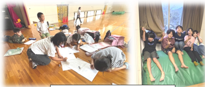
9月25日(金) 開催時の様子

■ 問合せ 中郷区まちづくり振興会 ☎74-2455 総務・地域振興グループ ☎74-2411