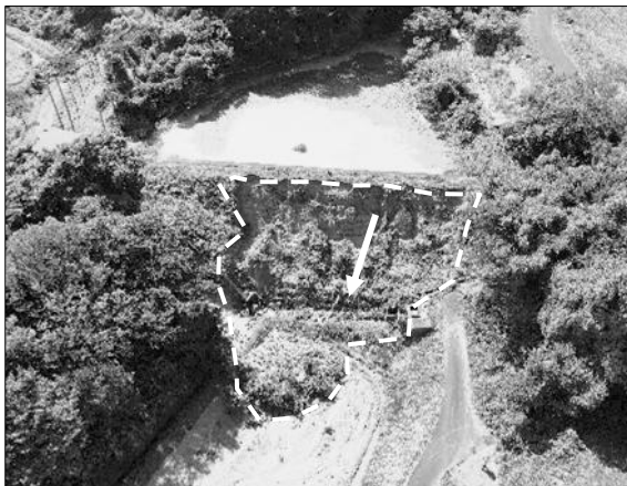
ため池堤体法面崩落（下宇山地内）