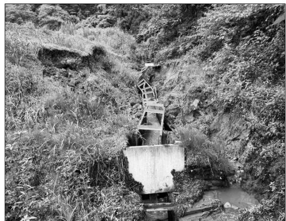
水路崩落（吉川区長坂地内）