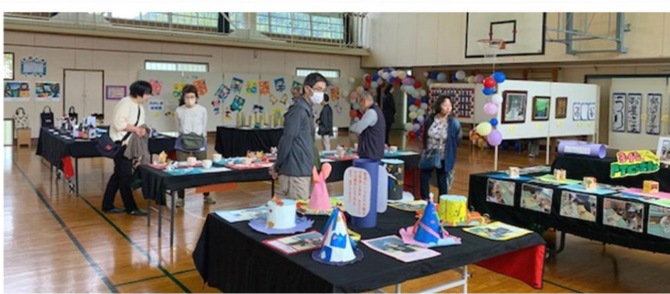
▲きらきらフェスティバル作品展示の様子

10月18日（土）大島小学校体育館で「大島きらきらフェスティバル」が、大島小学校文化祭と合同で開催され、多くの方からお越しいただきました。