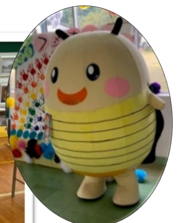
▲おーちゃんも観に来てくれました