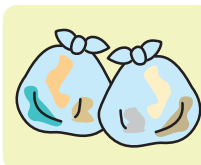
集積所の違反ごみ