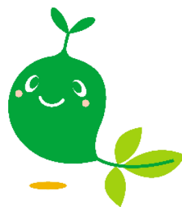
フェスティバlmスコットキャラクター グリップィ

■主催 上越市みどりのフェスティバル実行委員会 ※団体名に付いている番号等は、裏面会場図の出店位置を示します。