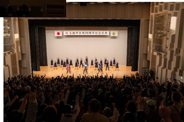
記念パフォーマンス