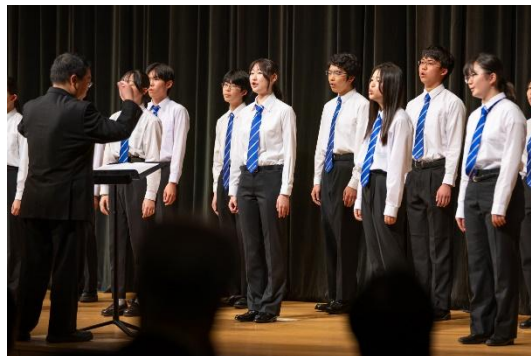
上越市民の歌「このふるさとを」 合唱披露