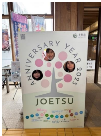
各イベントにて展示