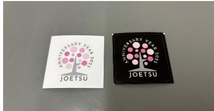
各イベント、市役所にて無料配布