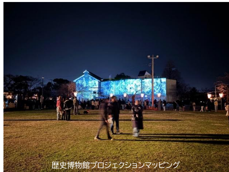
歴史博物館プロジェクションマッピング