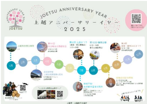
上越商工会議所×上越市 PRチラシ