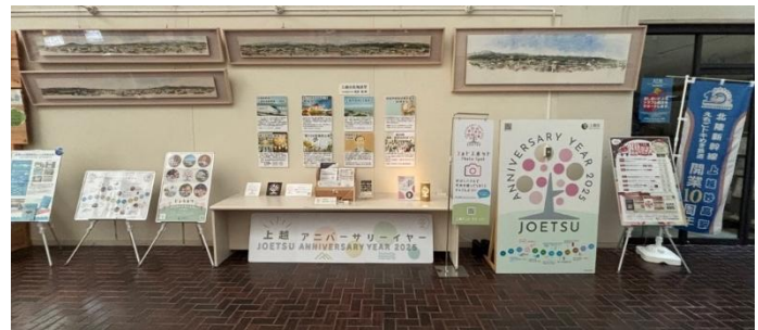
概要、各事業の紹介