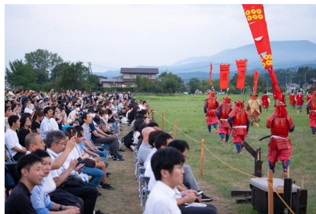
川中島合戦の再現