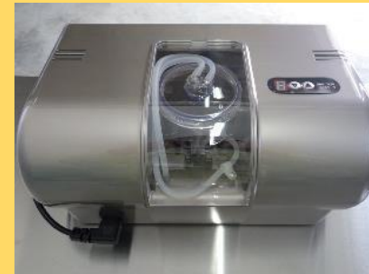
真空パック機シーラー

米の保管施設の一部を間仕切りし、漬物加工所とすることで、かりもり（堅瓜）の漬物を販売することができるようになった。さらに真空パック機械の購入で長期の保存が可能となり、生産量と販売額の拡大につなげることができた！