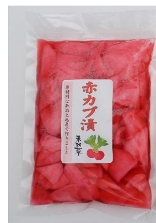
アカブ漬け 赤カブを保存する雪室の設置