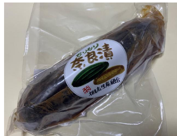
かりもり（堅瓜） 真空パック機の導入