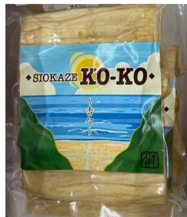
たぐわん（干し大根） 大根結束機の導入