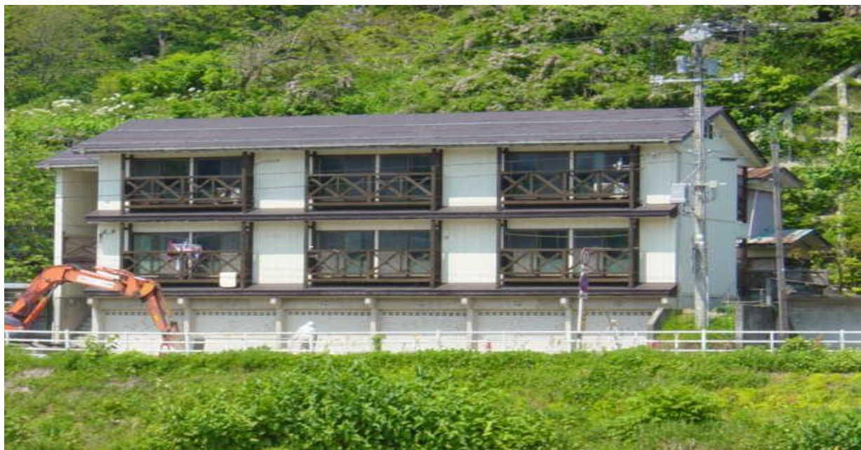
写真：旭第2住宅（名立区）