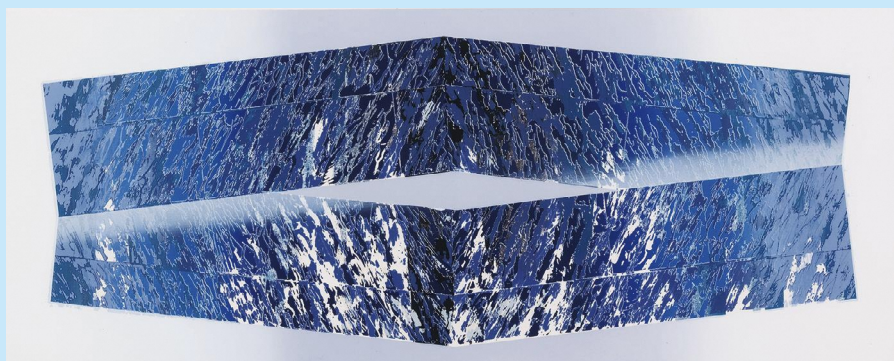
《the series of space'05B-2》