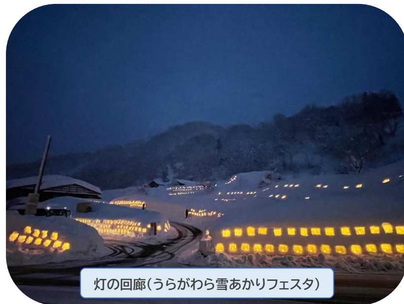
灯の回廊(うらがわら雪あかりフェスタ)