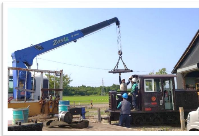
クレーン車にてエンジン部分の蓋を外している様子