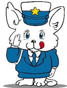
新潟県交通安全マスコット ルルちゃん