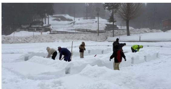
▲月影の郷の準備作業