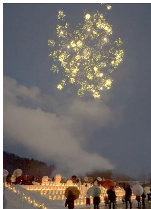
▲横川地内での打上げ花火