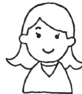
上越教育大学 学生

シェアハウスは、町家の風情を感じられるところが一番気に入っています。共有スペースは広くてキレイで使い勝手がいいです。料理の話や学校のできごとなど、気が向いた時に話せる相手がいるのは楽しいですよ。 高田駅に近く、本町通りのすぐ裏にあたるのでとても便利な所だと思います。 こと七の日には朝市が立ち、ご近所さんや朝市の皆さんと交流できるのも楽しみの一つです。ぜひ一度見学に来てみて下さい。