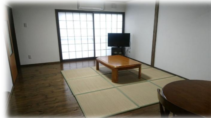
（約16.5畳の共有リビング）