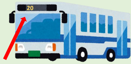
バスのばんごうが 20 か 21 が みなみがわせん(南川線)です。