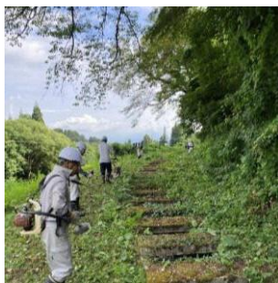
草刈作業への参加