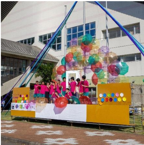
なかごう夏まつりでは、イベント用の舞台や流しそうめん企画など