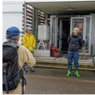
実施したスノーシューツアーの様子