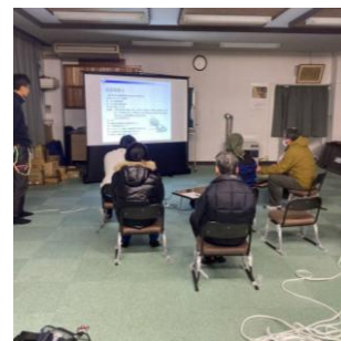
安全講習会の実施