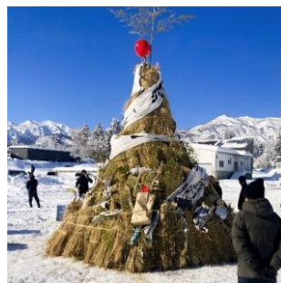
さいの神への参加