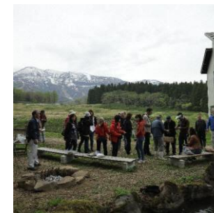
マウンテンバイクツアー 外国人ツアーイベントの補助