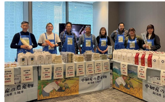
中郷区の農業者と日本曹達株式会社が連携した農産物販売会のチラシ作成を任せられ、地元二本木工場での試食販売会に参加。令和7年度は東京本社での試食販売会にも同行。