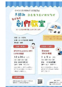
公民館でのワークショップの 講師・チラシ作り