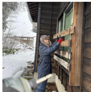
雪郷ロッジ運営作業の様子