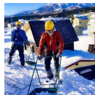
町内会での下ろし作業