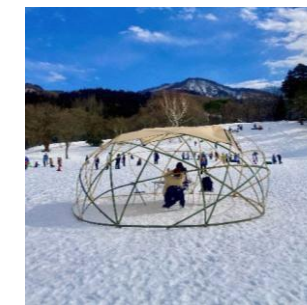
雪ん子まつりで スタードームづくり