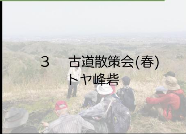
3 古道散策会(春) トヤ峰岩