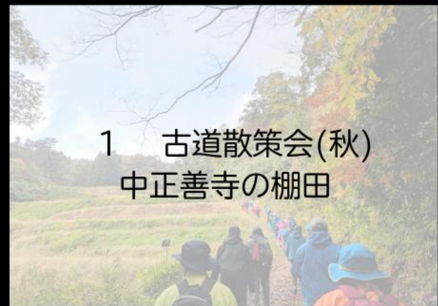
1 古道散策会(秋) 中正善寺の棚田