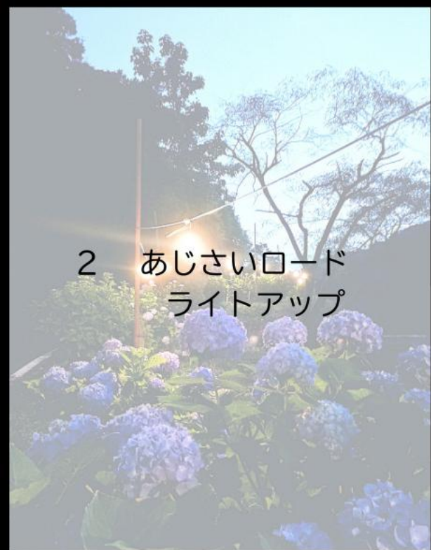
2 あじさいロード ライトアップ