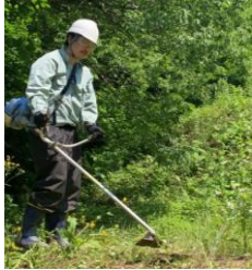
刈払い機取り扱い作業の安全衛生教育