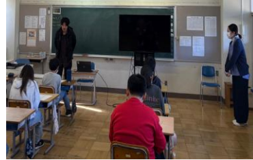
浦川原小学校6年生への講演（地域おこしの意義とは）