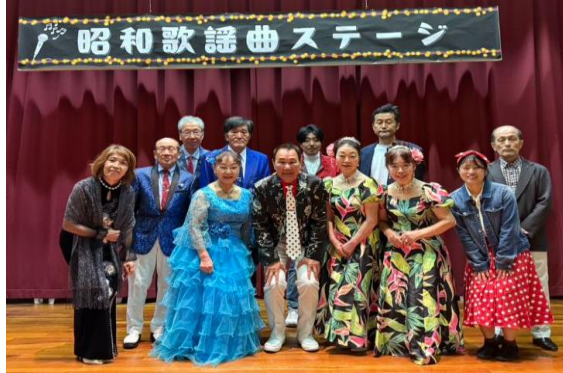
浦川原区ワークショップメンバーとイベント