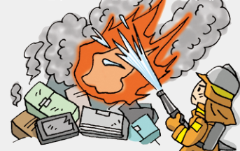
不適正な管理による火災

廃家電は電池やプラスチックを含むため、発火・延焼の危険性があり、不適正な管理による火災が発生しています。