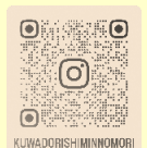
くわどり市民の森 Instagram